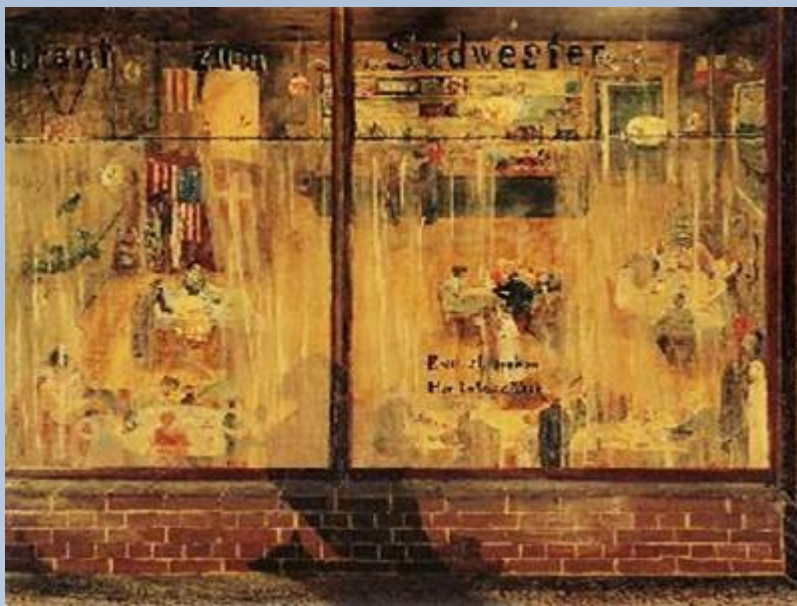
Bild: Hafenkneipe, 1933, Ringelnatz